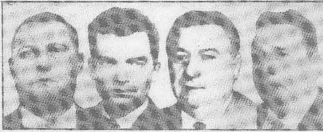
قتلة المهدي ابن بركة : ابوشيش، لوني، باليس ودوباوي